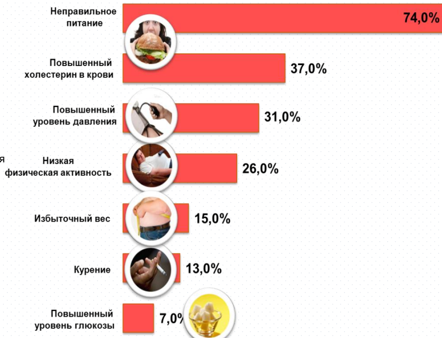
Факторы риска, которые выявлены в ходе диспансеризации в Чувашской Республике